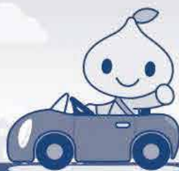
公式キャラクター ピットくん