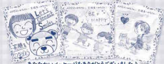
あたたかいメッセージをありがとうございました♪