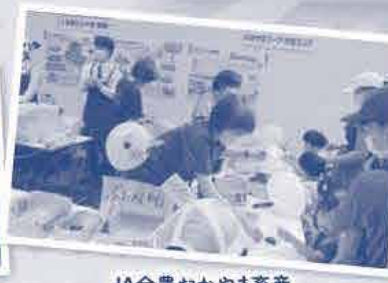
JA全農おかやま畜産 井笠エリア組合員と一緒に