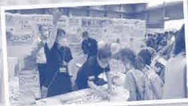
Cコレ商品の人気投票「C-1グランプリ」