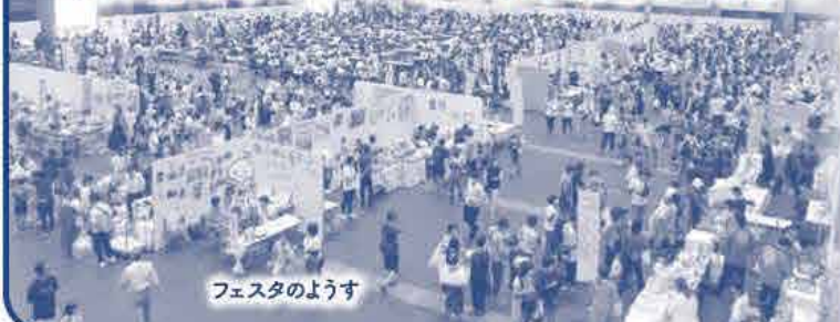
フェスタのようす