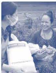
プレゼントされた「赤ちゃん キット~おかやまコープ」に 笑顔のお母さん