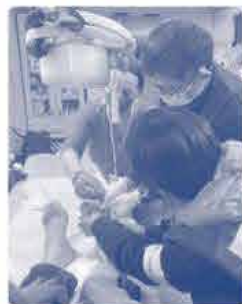
ハンガリーの仮設診療所にて AMDA医師たちがハンガリー看護師と ウクライナ避難者を診察するようす