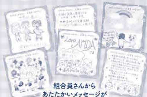
組合員さんから あたたかいメッセージが 寄せられました。