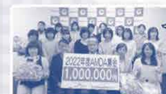
メッセージと プレゼントを お渡ししました。