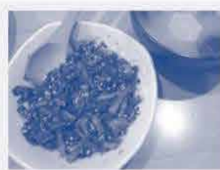
⑤ 料理 (大根葉ふりかけ)