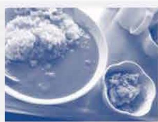
④ 料理 (福神漬け)