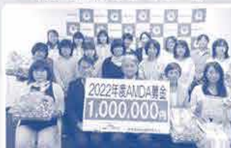
「募金贈呈式」のようす

おかやまコープを通じての募金は税法上の寄付金控除の対象になりません。予めご了承ください。