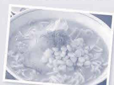
便利なチャックシール付き