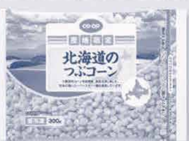
北海道のつぶコーン