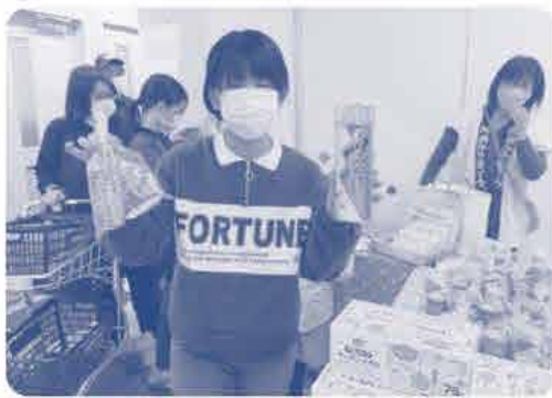
前回の誕生祭の様子