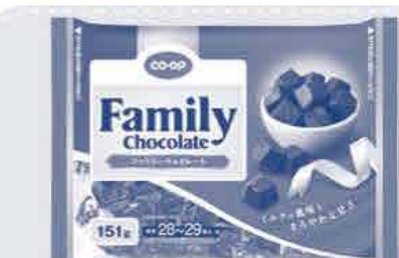
CO-OP ファミリーチョコレート 151g