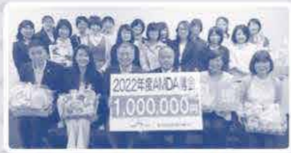
「募金贈呈式」のようす

昨年お寄せいただいた「メッセージ」は丁寧にファイリングした後、AMDA社会開発機構へお渡しし、大変喜んでいただきました♪