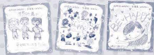
昨年のAMDA募金月間で組合員から寄せられたメッセージの一部

昨年お寄せいただいた「メッセージ」は丁寧にファイリングした後、AMDA社会開発機構へお渡しし、大変喜んでいただきました♪