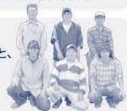
農事組合法人 伍協牧場のみなさん