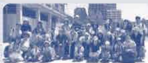
2019年の参加者の集合写真

1945年の8月6日と9日、広島と長崎に原子爆弾(原爆)が投下されたことは、若い世代や子どもたちには遠い過去のできごとになっています。悲惨な体験を繰り返さないためにも被爆地を訪ね、ヒロシマがつたえていることを親子で学び、一人ひとりができることを考えてみませんか。