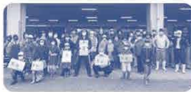
参加者みなで記念撮影📷

県北から瀬戸内海までは少し遠かったですが、漁船に乗ったり普段できない事が体験でき、良かったです。 美しい海の景色にも癒されました。 今回採ったアマモの種を海にまき日が楽しみです。