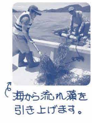
海から流れ藻を引き上げます。

＜里海づくりの取り組み＞ 2022年6月4日(土)に“海のゆりかご”アマモ場の再生活動として、日生の海で「アマモの種取り」をしてきました。日生うみラボでアマモの講習会の後、漁船に乗り込み、心地よい風を感じながらアマモ採取ポイントへ行きました。