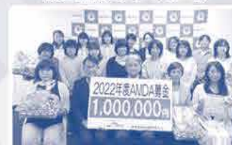
「募金贈呈式」のようす

昨年お寄せいただいた「メッセージ」は丁寧にファイリングした後、AMDA社会開発機構へお渡しし、大変喜んでいただきました♪