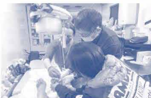
ハンガリーの仮設診療所にてAMDA医師たちがハンガリー看護師とウクライナ避難者を診察するようす