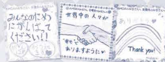
昨年のAMDA募金月間で組合員から寄せられたメッセージの一部

昨年お寄せいただいた「メッセージ」は丁寧にファイリングした後、AMDA社会開発機構へお渡しし、大変喜んでいただきました♪