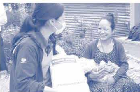
プレゼントされた「赤ちゃんキット~おかやまコープ」に笑顔のお母さん