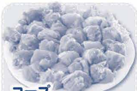
コープ おかやま若鶏