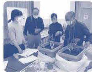
男性の参加もあり盛り上がりました。