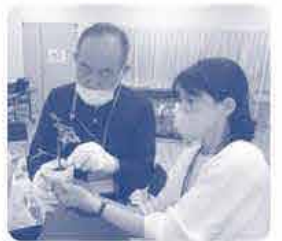
トマトの苗に向きがある事を初めて知りました。