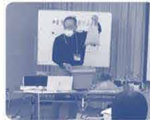
とてもわかりやすく説明してもらえました。