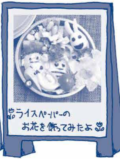
ライスハローのお花を飾ってみたよ

このページに関してのお問い合わせは エリア事務局 TEL (086) 256-2677 FAX (086) 256-2585