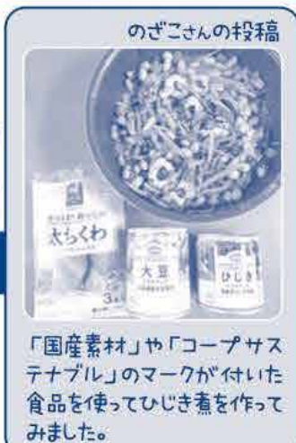
のぞこさんの投稿

「国産素材」や「コープサステナブル」のマークが付いた食品を使ってひじき煮を作ってみました。