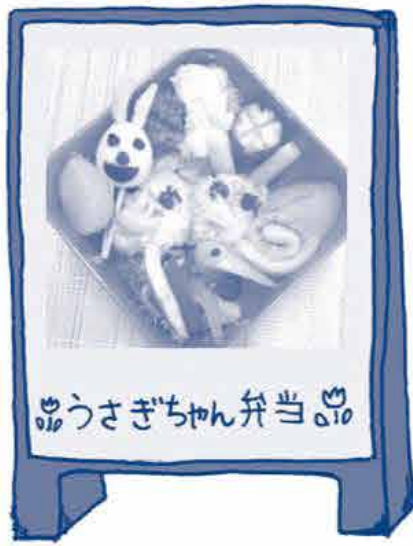
うさぎちゃん弁当