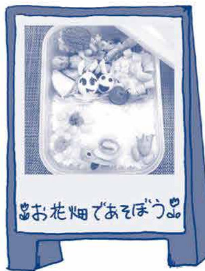
お花畑であそぼう