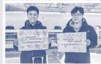
職員の被災地 派遣出発