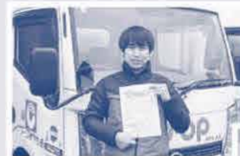
宅配での 募金の呼びかけ

「一日の最後、目を閉じて眠るときに、地震の怖さを思い出して不安になります。」「断水のため、毎日給水所に自転車で往復3時間かけて行っています。」毎日懸命に生活されていましたが、心のケア含めて長期的な支援があきらかに必要と強く感じました。いまの何げない生活に感謝しつつ、できる支援を続けたいと思います。