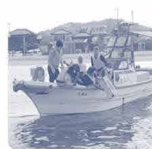
分かれて船に乗って高島や白石島の浅瀬に種をまきました。11月頃発芽予定!