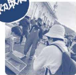
カキ殻を使って育てた里海米をいただきました