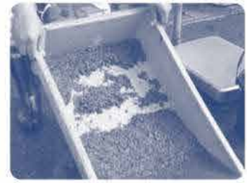
何回か繰り返すとアマモの種が見えてきます。