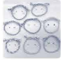
作ったミサンガで♡ Smile♡