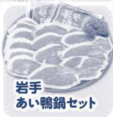
岩手 あい鴨鍋セット

元気な親鴨、元気なヒナ 親鴨はヒナの時にヨーロッパより定期的に輸入しています。そのため血が濃くならず、元気で卵をよく産む親鴨になります。そんな親から産まれてきた子も元気なヒナになります。約28日で卵を孵化させ、温度管理に気をつけながら約2ヶ月をかけて飼育されます。