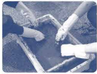
熟したアマモをカゴに入れ、塩水でよく洗います。

9月30日(土) 笠岡地区漁業連絡協議会が行っているアマモの種まきに小学生や高校生の皆さんとともに参加しました。活気あふれる作業風景でした!