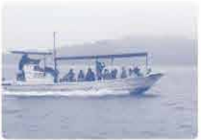
舟に乗って高島 周辺へ向かいます

6月21日(火) 天野産業株式会社が行った稚魚放流に漁協・市・県の関係者とともに参加しました。この放流は水産資源の保護と海洋環境の改善を目的として2012年から行われているものです。