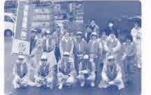
雨が降る中ではたが 楽しく参加できました

漁師さんの話では 2～3年前から黒メバルが 増えているそう。工事 で訪れる白石島の漁港 のそばで稚魚が増えて いるのを見ると10年経て きた交わりを感じる。