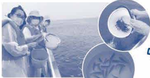
体長約5cmの 黒メバルの稚魚5000匹を放流