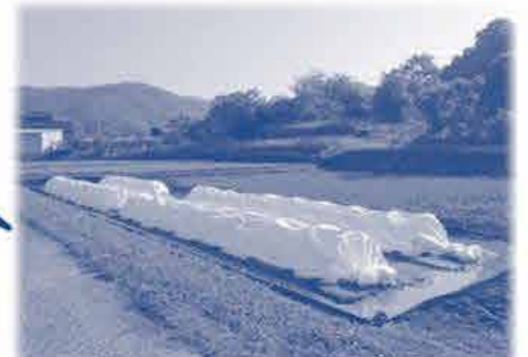
田んぼの中に作った苗代

このページに関してのお問い合わせは エリア事務局 TEL (086) 256-2677 FAX (086) 256-2585