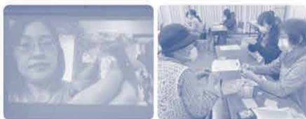
さわり織りのティッシュケースづくり

おかやまコープの支援はとてもありがたかった。荷以前届いたメッセージは大切にしています。