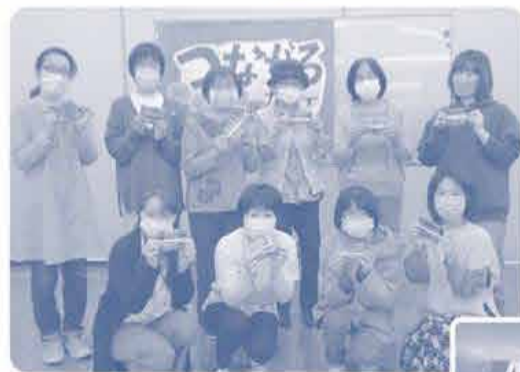
みんな素敵な ティッシュケースができました 貴重なお話ありがとうございました