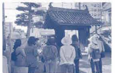
過去の戦跡めぐりの写真です