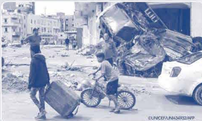
東部のデルナの洪水の被害を受けた町を歩く人々。(リビア、2023年9月11日撮影/AFP)

お寄せいただいた寄付は、安全な飲料水の確保や、医療物資や燃料の提供、心理社会的支援などユニセフが行う緊急・復興支援活動に役立てられます。