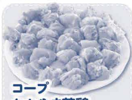
コープ おかやま若鶏