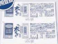
恩納村産 味付太もずく