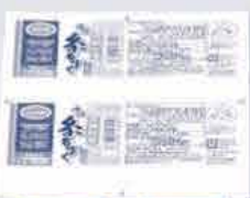
恩納村産 味付糸もずく