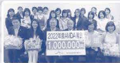
「募金贈呈式」のようす

昨年お寄せいただいた「メッセージ」は丁寧にファイリングした後、AMDA社会開発機構へお渡しし、大変喜んでいただきました♪