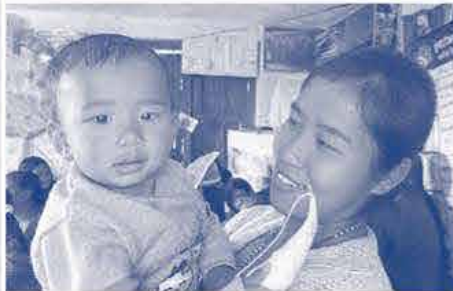
手作りプレゼントに笑顔の母子 (ネパール)