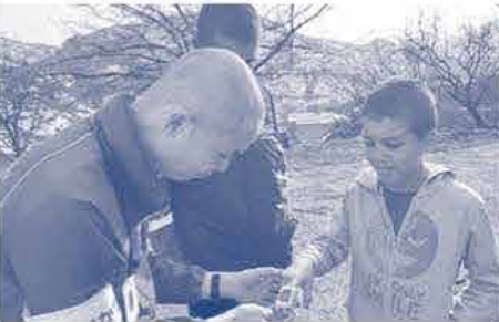
被災された方の健康チェックを行うAMDA医師 (トルコ地震被災者緊急活動)