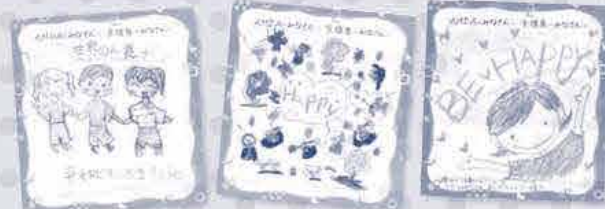
昨年のAMDA募金月間で組合員から寄せられたメッセージの一部

昨年お寄せいただいた「メッセージ」は丁寧にファイリングした後、AMDA社会開発機構へお渡しし、大変喜んでいただきました♪