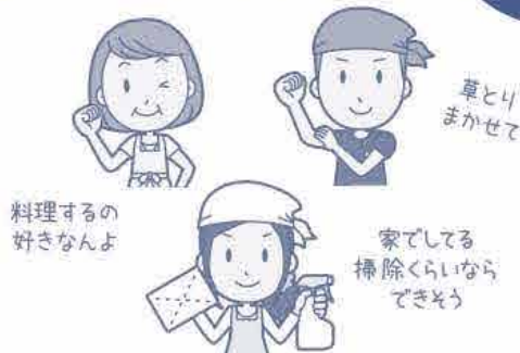
料理するの好きなんよ