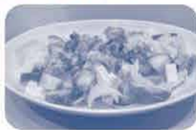
小さ目に切ってサラダトッピングしてボリュームUP!