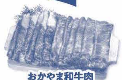
おかやま和牛肉 モモ・カタうす切りセット