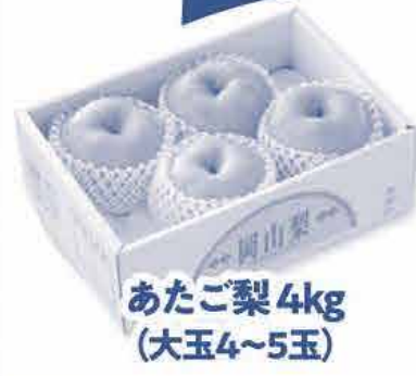
あたご梨 4kg (大玉4~5玉)