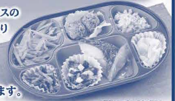
※写真はおかずコースの一例です。