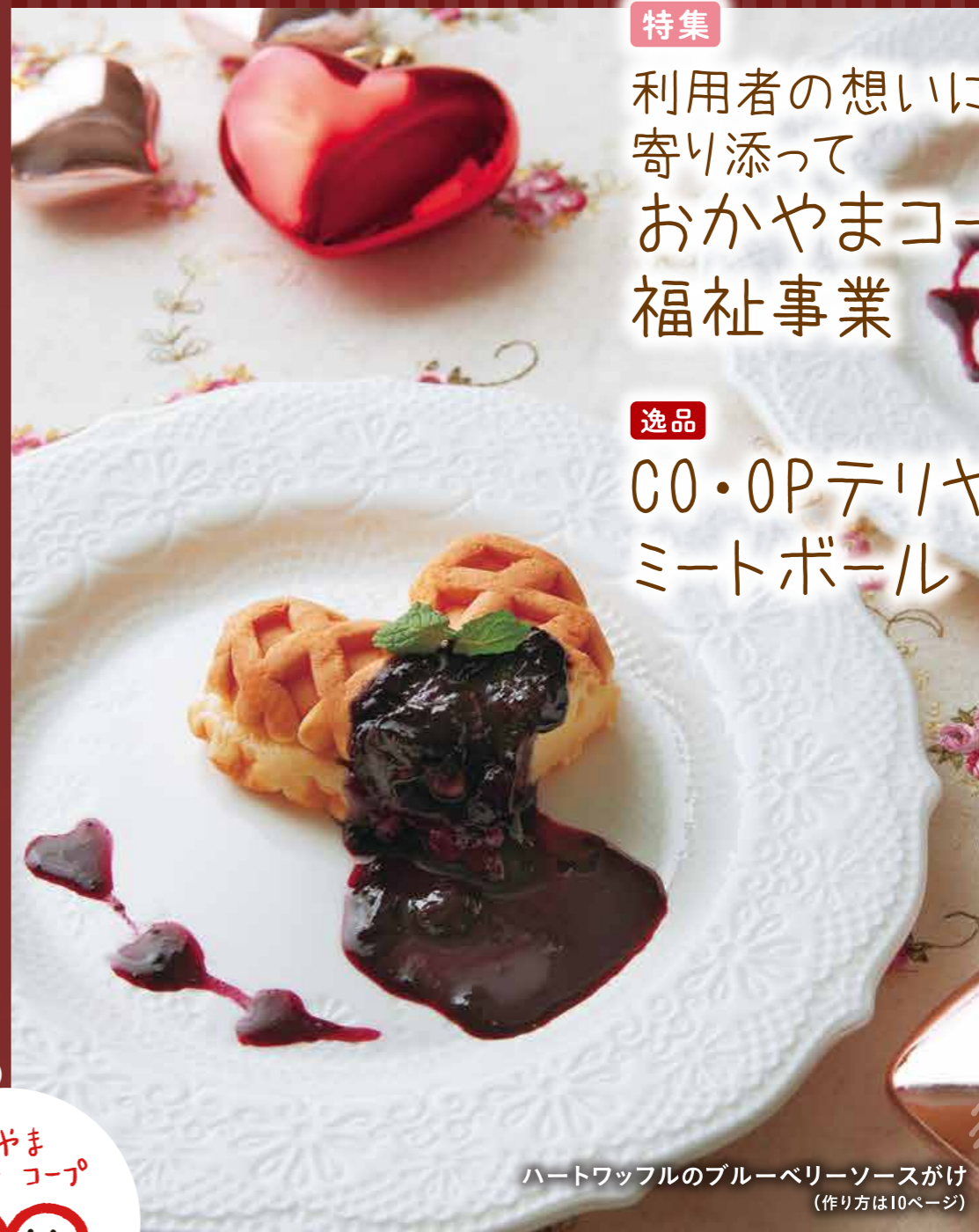
ハートワッフルのブルーベリーソースかけ (作り方は10ページ)