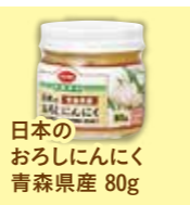
日本のおろしにんにく 青森県産 80g