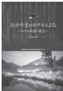
ホタル団体活動報告集

◆申込：下記参加申込書もしくは必要事項を10月19日(木)必着で、FAX、E-mail、郵送のいずれかでお申込みください。