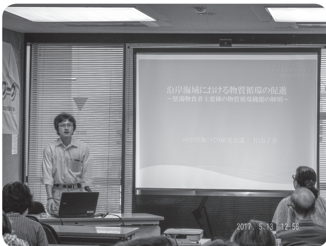
里海づくり研究会議