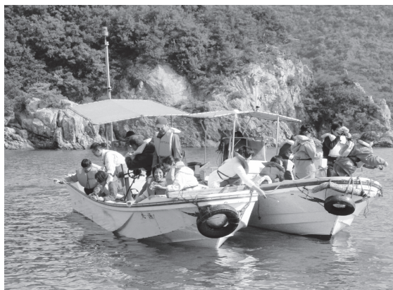
アマモ種まきイメージ