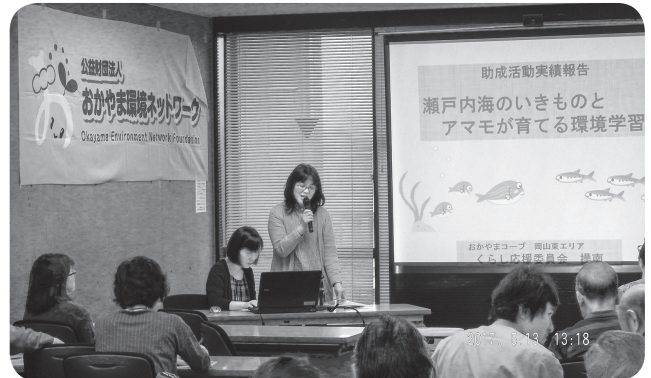
おかやまコープ岡山東エリア