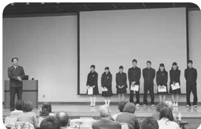
備前市立日生中学校の皆さん