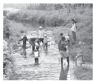
● 大野川・川あそび