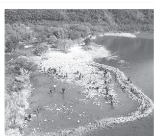
● 旭川かいぼり調査