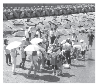
● 8月笠岡アマモ再生教室