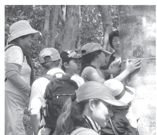
● 森林公園を歩こう