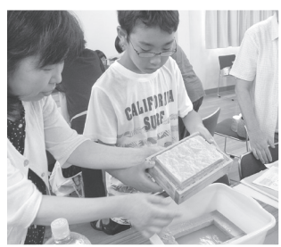
● 紙はごみじゃない講座