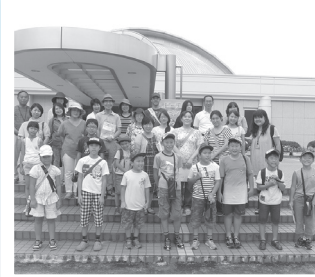
● カブトガニ博物館見学会