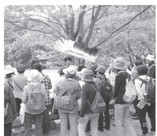
● みんなの自然観察会