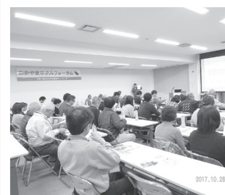
● ホタルフォーラム