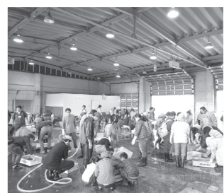
● 日生アマモ種選別体験