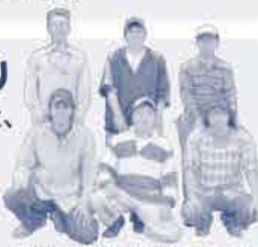
農事組合法人伍協牧場のみなさん