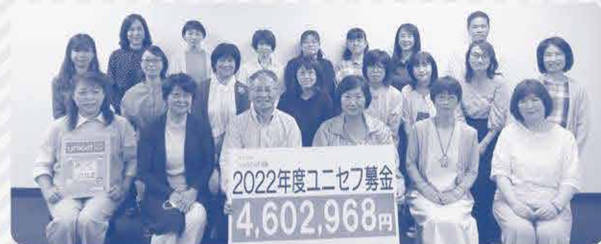
募金を贈呈した組合員の代表と記念撮影

6月8日(木)、2022年度にユニセフ募金で集まった460万2,968円を、岡山ユニセフ協会を通じて 日本ユニセフ協会へ贈呈しました。そのうち100万円は「トルコ・シリア地震緊急募金」として2月に贈呈しています。 皆様からの心のこもった募金は、最も支援の届きにくい子ども達を最優先に、190の国と地域で活用されます。