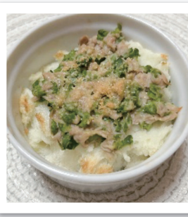
アスパラガスとパンでボリュウムたっぷり♪

◎岡山県保健医療部健康推進課健康づくり班 岡山市北区内山下2-4-6 岡山県庁5階 TEL:086-226-7328 FAX:086-225-7283 https://www.pref.okayama.jp/soshiki/36/