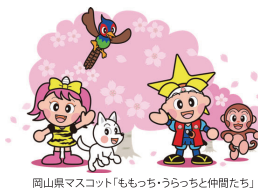
岡山県マスコット「ももっちゃん」と仲間たち