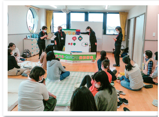
パネルシアター「すごい野菜パワー」(高島おひさまこども園)

☆活動のようす☆ 放課後児童クラブや子育てひろば・おやこクラブなどで出前授業をおこなっています！