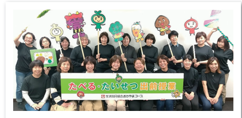
私たち「たべる・たいせつ」サポーターがお伺いします！