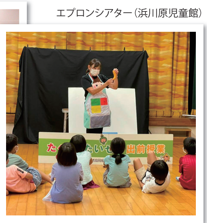
エプロンシアター(浜川原児童館)