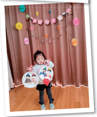
完成したおひなさまを持ってハイポーズ！