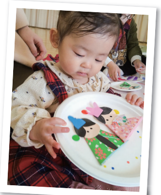
かわいいおひなさまが完成〜！