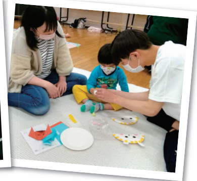
折り紙を教えてもらったよ