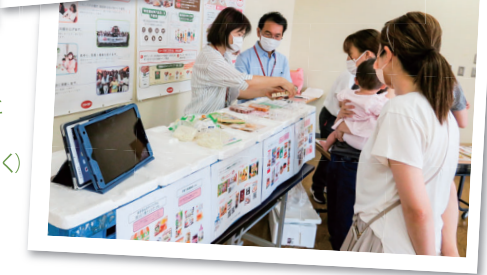
早起きすれば朝ごはんがおいしいよ!

※コープのお店では、全店できらきらステップときらきらキッズの商品を取り扱っています。毎月5のつく日は2割引になります。(一部商品除く)ぜひご利用ください。