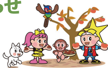
岡山県マスコット「ももっち・うらっちと仲間たち」

今回は「さつまいも」を紹介します。収穫は8~11月頃ですが、2~3カ月貯蔵して、余分な水分を逃がしてからのほうが甘みが増してホクホクとした食感になるため、10~1月頃が旬となります。