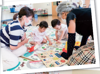
お友達と一緒にパズルで あそんだよ!