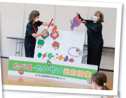
野菜をしっかりと食べることは とっても大切なんだ!