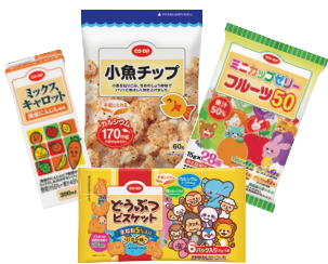
この4つが入ったお菓子セット♪ ※プレゼント内容は変わる場合があります。