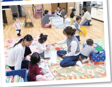
広い場所だから おもいっきり遊べるね!