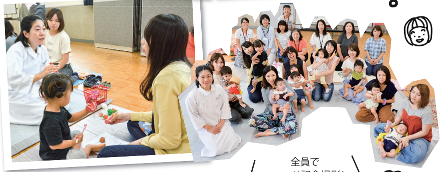
全員で ニコリ記念撮影!