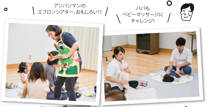
アンパンマンの エプロンシアター、おもしろい!!

9月の「子育てひろば あいあい」(コープ北畝・コープ倉敷北)では「親子でエンジョイ!レッツ♡トライ!!」が開催され、多くの親子が参加しました。エプロンシアターやベビーマッサージ、医療生協の方による歯みがき指導などで親子のスキンシップをはかり楽しく過ごしていました。1歳前後のお子さんを持つお母さんが多く、子育ての悩みを話す姿もありました。