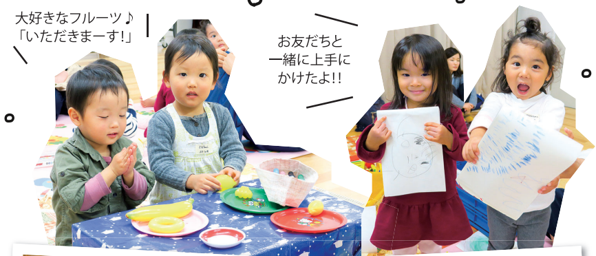
大好きなフルーツ♪ 「いただきまーす!」

参加したお母さんからは「家のおもちゃに飽きてしまって、ここに来るといろいろなおもちゃがあるのでありがたいです」、「スタッフの方が子どもたちに話しかけてくれたり、関わって遊んでくれたりするので安心できます」などの声が寄せられました。