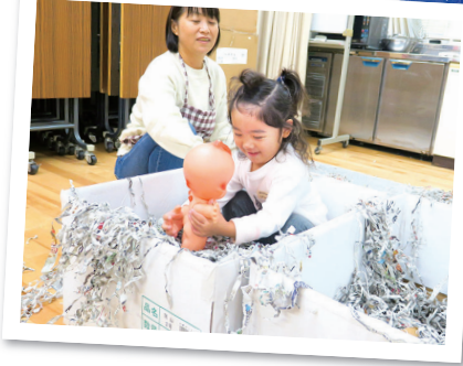
キューピーちゃんと一緒に新聞おふろ♪