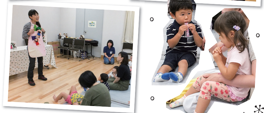
うんとこしょ、どっこいしょ!