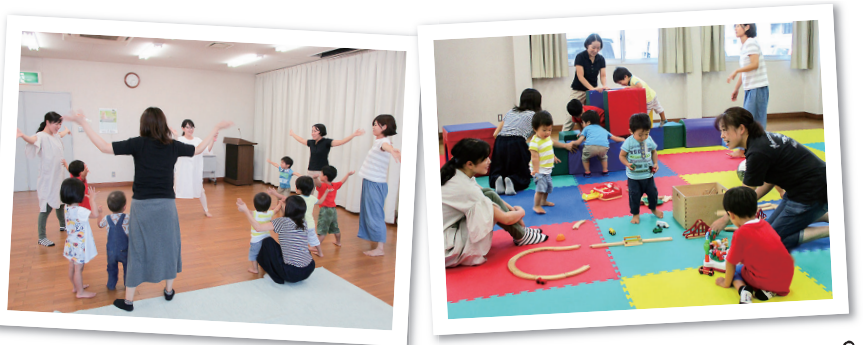
ベビー・キッズヨガで身体をほぐそう!