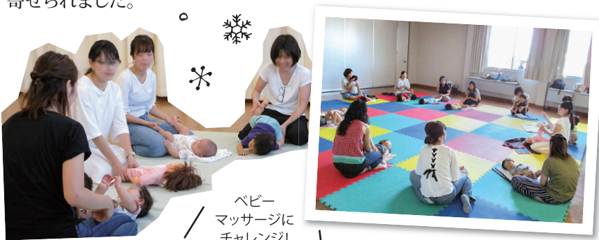
ベビー マッサージに チャレンジ!

参加者からは「子どもと触れ合えてとてもリラックスできた」などの感想が寄せられました。