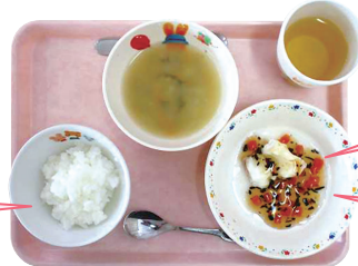
「子育て真っ最中のあなたへ贈るわくわくもぐもぐ★食育ガイド」から引用

「わくわくもぐもぐ★食育ガイド」については、岡山県保健福祉部健康推進課もしくは、お近くの保健所・支所にお問い合わせください。岡山県ホームページにも掲載しています。 ◎岡山県保健福祉部健康推進課健康づくり班 岡山市北区内山下2-4-6 岡山県庁5階 TEL:086-226-7328 FAX:086-225-7283 http://www.pref.okayama.jp/soshiki/36/