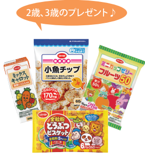
この4つが入ったお菓子セット♪ ※プレゼント内容は変わる場合があります。

娘が一番好きなもの、それは「干しいも」です。一袋あつという間に食べてしまうほど、大好きです。2歳前で、言葉はどちらかというと少ない方ですが、「イモ、イモ」は言えるほど。お菓子も好きですが、干しいものように安心して食べさせられる食品が手に入るのありがたいです。国産のものは少し高いので、もう少しお手頃になるとうれしな。