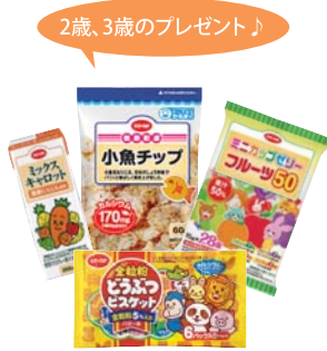
この4つが入ったお菓子セット♪ ※プレゼント内容は変わる場合があります。

子どものバースデープレゼントのお菓子、すごくびっくりしてうれしかったです！思い切った始めたコープ、今ではすっかり気に入って助かっています。特に、切らなくて済むお肉とお魚は大好きです。骨なしもあるので、子どもにも安心して食べさせられます♡だし汁が無添加なのもうれしいですし、チンしてできるかぼちゃコロッケもすごくおいしかったです。仕事をしているので大助かりです！