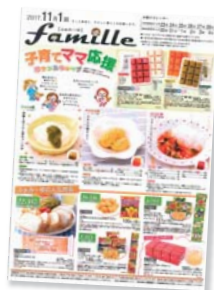
宅配カタログ『ふあみゅ』

3歳、1歳のお誕生日プレゼント、ありがたうございました♡子どもたちも喜び、私もうれしかったです。小さな子どもたちのための食材(「ふあみゅ」など)、とても重宝しています。これからも期待しています♡