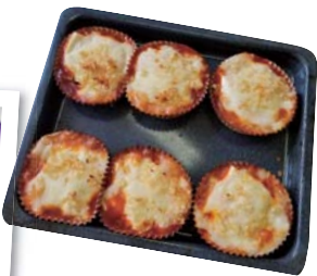
とろ〜りお豆腐のヘルシーグラタンの試食も!