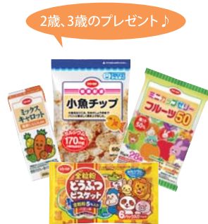
この4つが入ったお菓子セット♪ ※プレゼント内容は変わる場合があります。

娘の2才の誕生日にプレゼントありがとうございました。仕事で忙しく、誕生日の週の配達にプレゼントが入ってびびりしました。それで初めて今週が誕生日だったと気がきました。お菓子は喜んで食べています。ミックスキャラットのジュースが大好きで常に在庫しています。