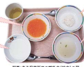
写真:ある保育所での離乳食(給食)の例